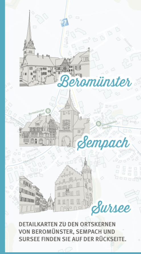
DETAILKARTEN ZU DEN ORTSKERNEN VON BEROMÜNSTER, SEMPACH UND SURSEE FINDEN SIE AUF DER RÜCKSEITE.